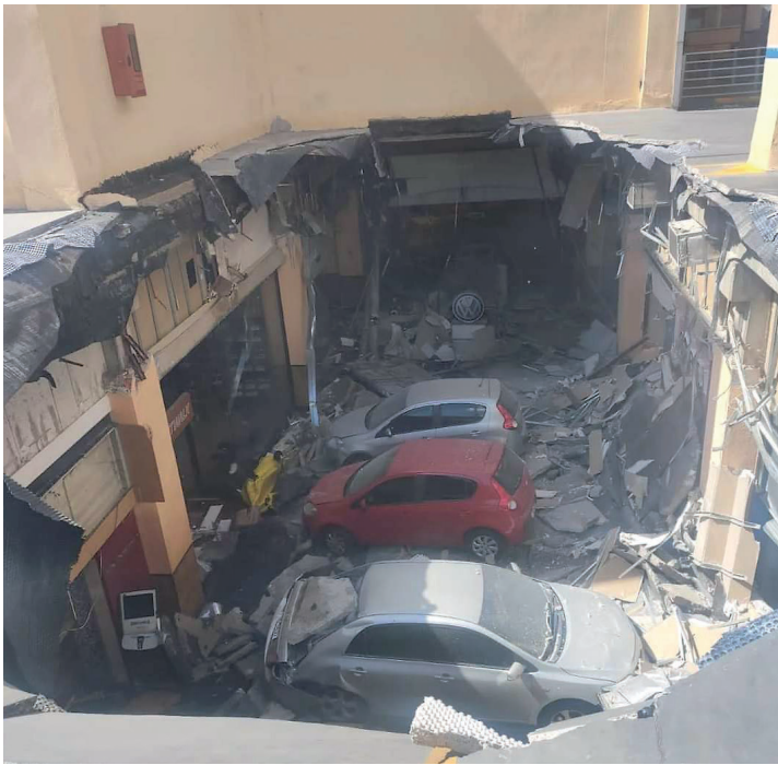
O local ficará interditado por tempo ilimitado

rança de colaboradores e clientes. A administração segue comprometida em identificar as causas do ocorrido e dar o suporte necessário aos lojistas e frequentadores para reestabelecer a normalidade o mais rapidamente possível.