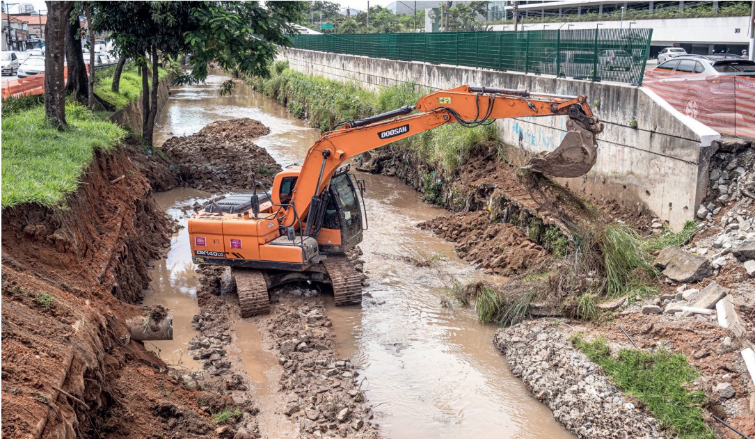
Todo o trecho do córrego a ser refeito tem 27 metros de extensão por 3,5 metros de altura.

A Prefeitura também fará um alargamento de cerca de 1,5 metro no córrego