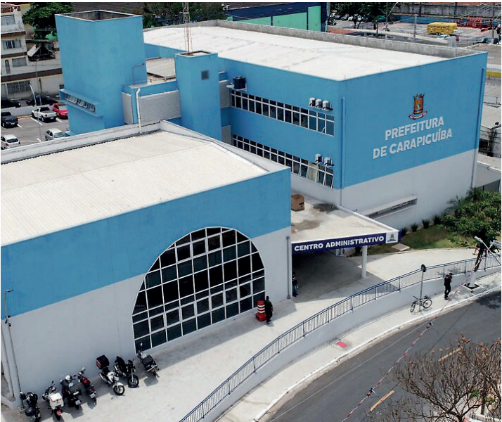
A Secretaria de Receita e Rendas, na Rua Joaquim das Neves, 211

- Cópia da Certidão de Nascimento ou casamento - Cópia da Certidão de Óbito do cônjuge - Comprovante de residência (água ou energia elétrica - com até 60 dias) do requerente ou procurador (apresentar procuração) - Cópia do espelho do IPTU do ano corrente ou Certidão de Isenção de período anterior - Comprovante de rendimento familiar - com prazo de até 60 dias, previsto na Lei nº 3538/2018 - Cópia do contrato de