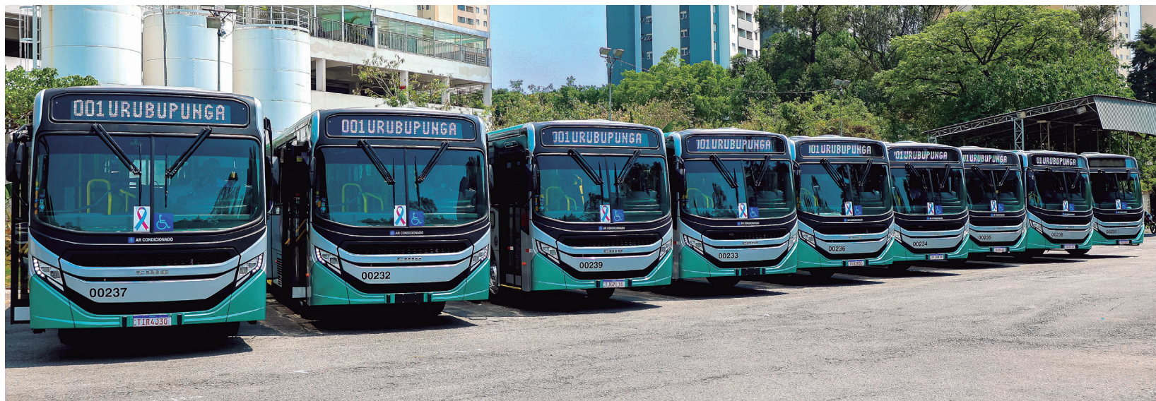
Os novos coletivos são da marca Mercedes-Benz

Os coletivos são da marca Mercedes-Benz, modelo OF 1726, zero quilômetro, carro-