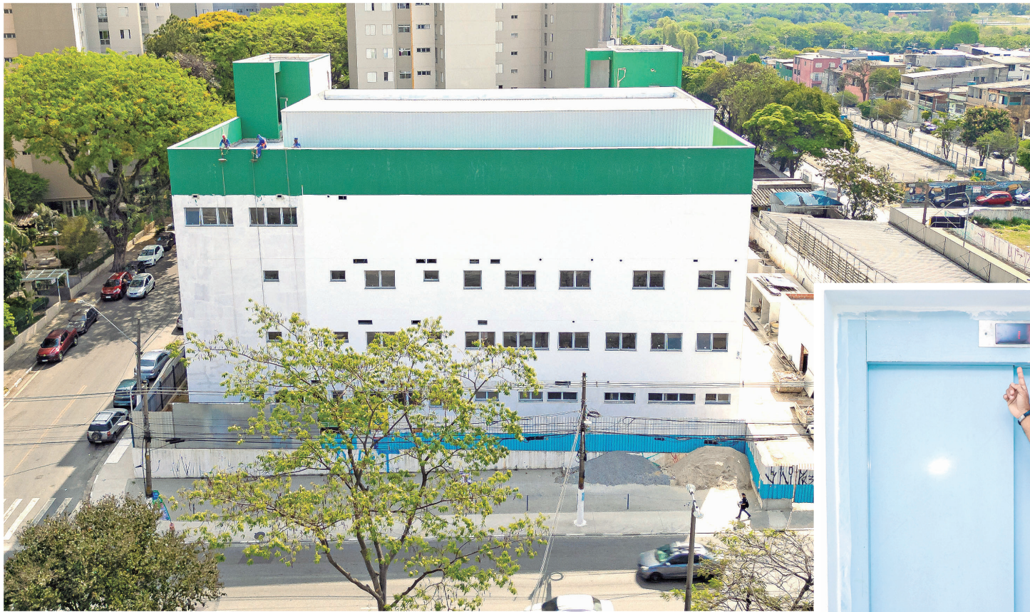
O Hospital terá dois prédios, sendo que o principal contará com quase 60 leitos

tão com piso. Nos próximos dias começam a ser instaladas as pias e vasos sanitários nos banheiros.