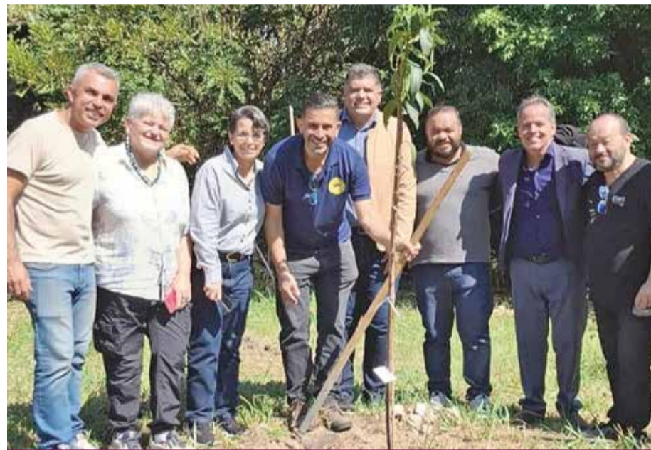
"2ª EXPO CTER 2026"