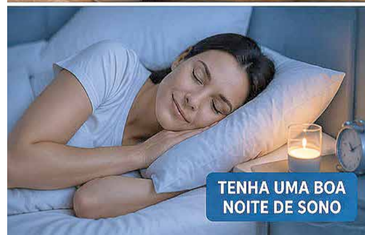
TENHA UMA BOA NOITE DE SONO