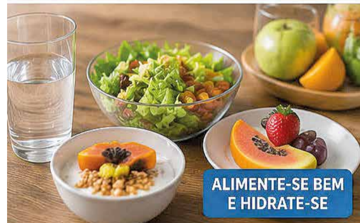
ALIMENTE-SE BEM E HIDRATE-SE