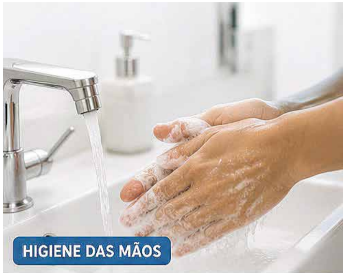
HIGIENE DAS MÃOS